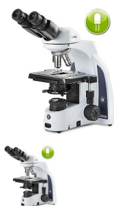
Euromex IScope Binokular Mikroskop IS.1152-PLi

Biologisches Binokular-Mikroskop mit LED Beleuchtung